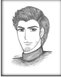
أسيد، أغسطس 1985